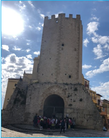
La Torre del Castellone

Finalità: Conoscere il territorio dal punto di vista storico, geografico e ambientale